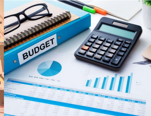
Les finances P9