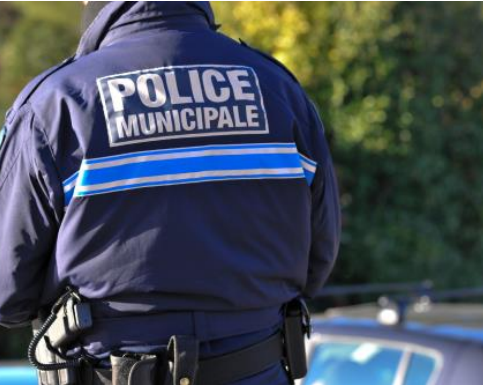
La sécurité P5