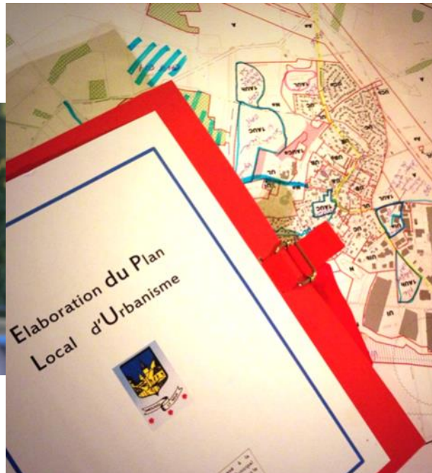
L'urbanisme P6, 7 et 8